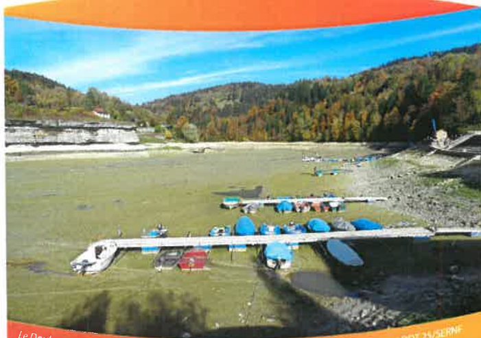
Le Doubs à Villers le Lac (10/2018)

Économiser l'eau, c'est protéger la ressource mais c'est aussi réduire ses dépenses