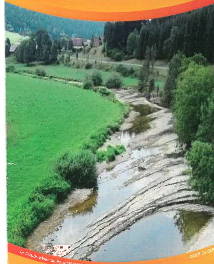
Le Doubs à Ville du Pont (09/2018)